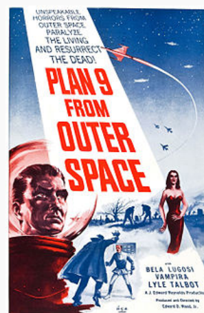
Affiche du film.