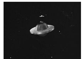
Soucoupe volante dans Plan 9 from Outer Space .

Il fallut presque trois ans pour trouver un distributeur intéressé par ce film. [réf. nécessaire]