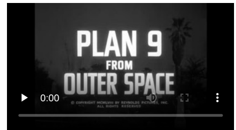
Plan 9 from Outer Space