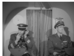
L'ombre d'un micro apparaît nettement dans le cockpit.