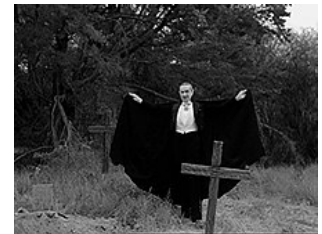
L'acteur Bela Lugosi dans son dernier rôle à l'écran. Il meurt peu avant le début du tournage, et quelques scènes isolées tournées auparavant seront intégrées dans le montage, quand bien même elles ne représentent que quelques minutes.