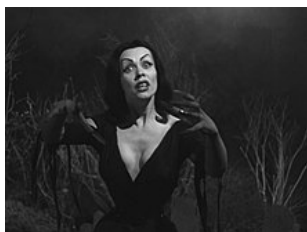
L'actrice Maila Nurmi ( Vampira ) interprète une mort-vivante.

Pour financer son film, Ed Wood obtint des fonds d'une Église baptiste . Afin de satisfaire la production, tous les membres de l'équipe du film se firent baptiser 2 .