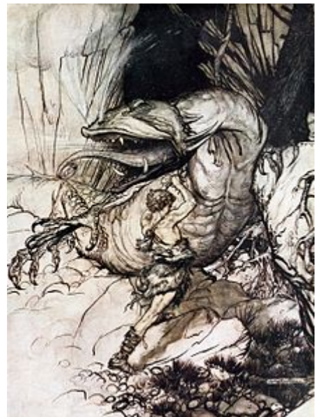
Siegfried tuant Fafner , par Arthur Rackham (1911)

Fáfnir est, dans le cycle de Sigurd de la mythologie scandinave , le fils de Hreidmar et le frère de Regin et d' Ótr , originairement un nain relativement puissant, qui, après s'être emparé du trésor maudit de son père, prend la forme d'un dragon aux allures de serpent afin de le protéger. Il est finalement mis à mort à l'instigation de son propre frère Regin, par le héros Sigurd 1 .