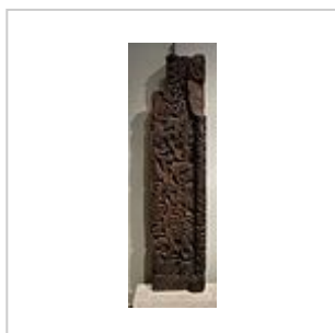
Sigurd et le forgeron Regin; Sigurd tuant le serpent Fáfnir (à droite) et ensuite Regin (à gauche).