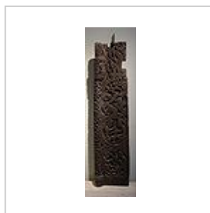
Portail de l'église en bois debout médiévale de Hylestad, Setesdal , Norvège. (L'église est détruite)