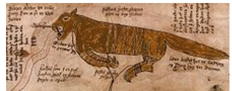
Fenrir enchaîné. Manuscrit ÁM 738 4to, 1680, Reykjavik , Institut Árni Magnússon .

«Tais-toi, Týr, Jamais tu n'as su Rétablir la paix entre deux opposants; Ta dextre, Je la mentionnerai, Celle que t'arracha Fenrir.»