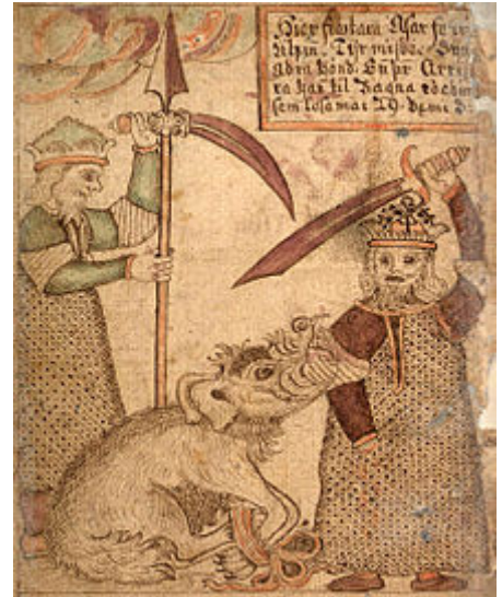
Fenrir arrache la main de Týr. Manuscrit SÁM 66, 1765, Copenhague, Bibliothèque royale .

Seul Týr a le courage d'accepter la proposition, et il s'exécute. Fenrir attaché se démène mais plus il essaye de se libérer, plus le lacet se raidit. Alors tous les Ases éclatent de rire, sauf Týr, qui venait de perdre sa main. Les dieux attachent les liens au sol tandis que Fenrir se débat et tente de les mordre. Pour l'en empêcher, les Ases lui mettent une épée en travers de la gueule (la garde reposant sur la mâchoire inférieure et la pointe à l'opposé). Depuis, le loup ne cesse de rugir, et de la bave s'écoule de ses mâchoires formant les fleuves Ván (espoir) et Víl (volonté). Il restera ainsi attaché jusqu'à la bataille prophétique du Ragnarök , lorsque toutes les chaînes se briseront 5 .