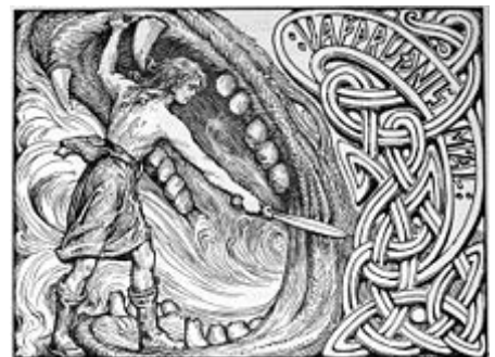
Vidar combat Fenrir. Illustration de W. G. Collingwood (1908).

À la bataille, Fenrir engloutira Odin . Mais le loup sera ensuite tué par Vidar qui lui déchirera la gueule, description en désaccord avec la Völuspá dont les vers sont pourtant cités dans le texte.