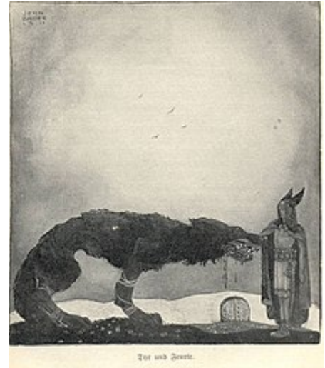
Týr sacrifie son bras dans la gueule de Fenrir, illustration de John Bauer (1911).