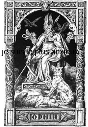
Hugin et Munin aux côtés d'Odin.

20. Huginn et Muninn Volent chaque jour Au-dessus du sol immense ; Je m'inquiète que Huginn Ne revienne pas, Pourtant c'est pour Muninn que je suis le plus anxieux 4 .