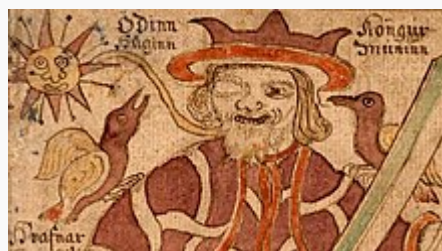
Hugin et Munin perchés sur les épaules d'Odin.