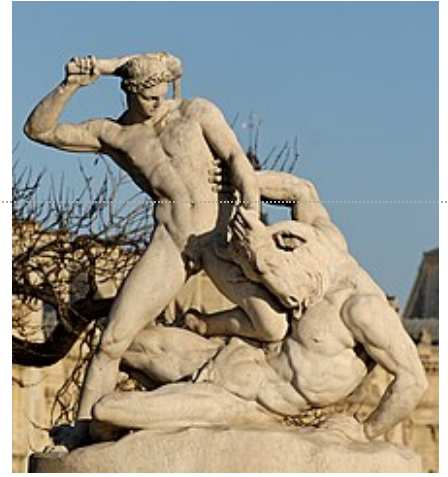
Thésée affrontant le Minotaure, d'après une sculpture de Jules Ramey , marbre, 1826, exposée au jardin des Tuileries, à Paris.

Minotaure, le tua, à mains nues selon Apollodore et retrouva son chemin dans le labyrinthe grâce à la bobine déroulée 13 . »