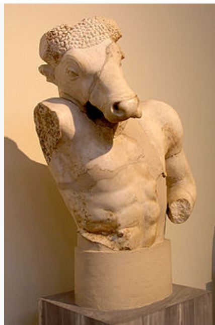
Minotaure, copie d'une statue de Myron , Musée national archéologique d'Athènes .

Au niveau symbolique, le minotaure représente l'homme dominé par ses pulsions instinctives 4 . C'est une figure très connue du bestiaire thérianthropique grec, qui a été reprise dans de très nombreuses œuvres, à la fois dans l'art, la littérature, le cinéma, le jeu de rôle et le jeu vidéo.