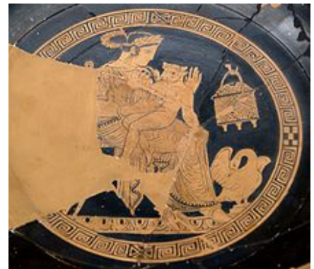
Pasiphaé et le Minotaure . Kylix attique à figures rouges , 340-320 av. J.-C., Cabinet des médailles de la Bibliothèque nationale de France .

L'essence du mythe de la naissance du minotaure a été exprimée de manière très succincte dans les Héroïdes attribuées à Ovide , où la fille de Pasiphaé se plaint de la malédiction de l'amour non partagé de sa mère : « Le taureau est la forme déguisée d'un dieu, Pasiphaé , ma mère, victime de cette illusion, a enfanté dans la douleur » 10 .