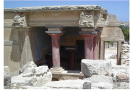
Le palais de Cnossos pourrait être à l'origine du mythe du labyrinthe selon certains archéologues 7 .

Suivant les conseils de ses oracles , Minos enferma ce monstre dans une prison construite tout exprès par Dédale , le Labyrinthe . Avec son enchevêtrement de méandres, il était impossible pour le Minotaure de trouver la sortie 9 . »