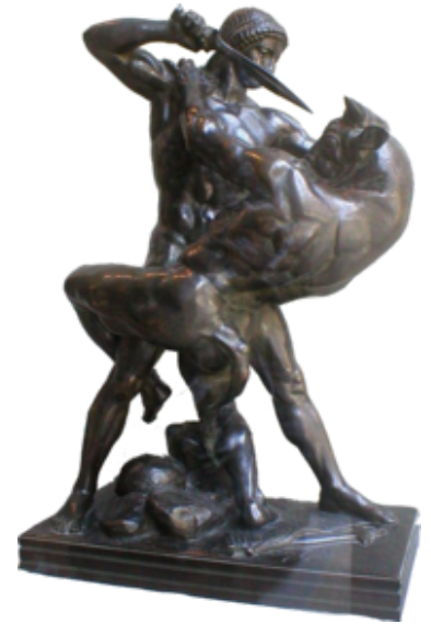
Thésée tuant le Minotaure, par Barye .

Selon Jorge Luis Borges , la figure du Minotaure est née du culte du taureau et de la double hache ( labrys , qui a donné le mot labyrinthe ) qui était fréquent dans la religion préhellénique qui célébrait aussi des tauromachies sacrées. Des peintures murales représentant des hommes à tête de taureau ont été retrouvées, et cette créature aurait pu faire partie de la démonologie crétoise . L'histoire du minotaure serait alors une version « tardive et maladroite » de mythes beaucoup plus anciens et de « songes effrayants » 20 . L'image du minotaure est presque indissociable de celle du labyrinthe, toujours selon l'interprétation de Borges, parce que l'idée d'une maison bâtie pour que les gens s'y perdent est aussi étrange que celle d'un homme à tête de taureau, et qu'il est normal qu'au centre d'une maison monstrueuse vive un habitant monstrueux 20 . Ainsi, pour Vincent Message , « l'architecture hors-norme du labyrinthe répond à la nature hybride du Minotaure, leurs monstruosité se correspondent 21 . »