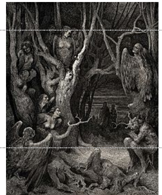
Les harpies tourmentant des damnés du 7 e Cercle des Enfers (suicidés changés en arbres) devant Dante et Virgile . Illustration de La Divine Comédie , probablement par Gustave Doré .