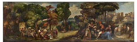
Énée et la prédiction des harpies par Dosso Dossi (vers 1515).