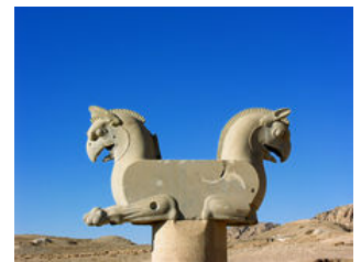
Homas achéménide de Persépolis, semblables à des griffons.