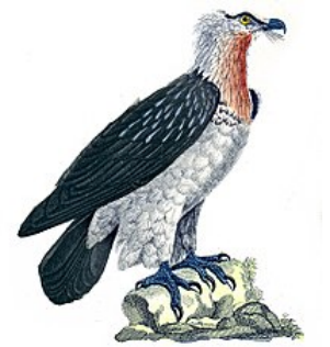
Griffon (en fait un gypaète barbu ) au XIX e siècle dans les œuvres complètes de Buffon (1837)