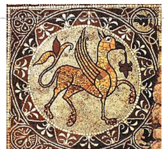
Griffon : chimère antique, dessinée dans une mosaïque.

Jean de Mandeville relate le récit de son prétendu voyage en Asie dans le Livre des merveilles du monde (écrit entre 1355 et 1357). Au chapitre XXIX, il évoque la contrée de Bacharia en Asie, où les griffons sont particulièrement nombreux 9 :