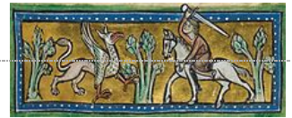
Griffon dans un bestiaire du XIII e siècle