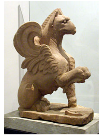
Griffon trouvé à Saqqarah, Musée national d'Alexandrie

En Italie, Plin l'Ancien évoque d'ailleurs ce qu'Hérodote et Aristée de Proconnèse disent sur les Arimaspes et les griffons dans le livre 7 de son Histoire naturelle 4 . Dans le livre 10, il dit de cet animal qu'il possède un bec crochu terrible et qu'il habite l' Éthiopie 5 .