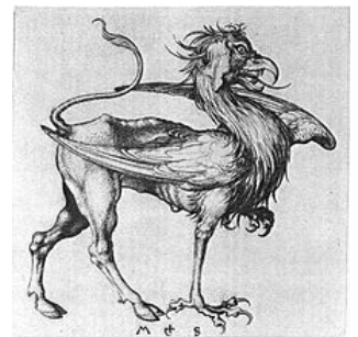
Gravure de Martin Schongauer , v. 1475-85.