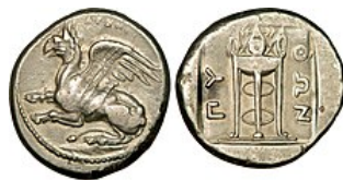
Statère en argent représentant un griffon bondissant