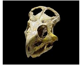
Crâne de protoceratops qui aurait engendré la légende du Griffon