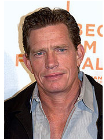
Thomas Haden Church incarne Flint Marko/L'Homme-Sable dans Spider-Man 3 (2007).