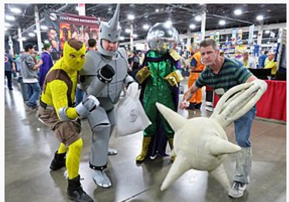
Cosplay de l'Homme-sable (à droite), avec

Personnage de fiction apparaissant dans The Amazing Spider-Man .