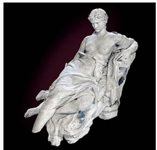
Velléda par Laurent Marqueste vers 1877.