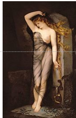
Charles Voillemot, Velléda , 1869.

Chateaubriand, notamment, s'inspire du personnage pour créer son héroïne des Martyrs Velléda , druidesse vierge de l' île de Sein , véritable symbole de la femme gauloise 9 .