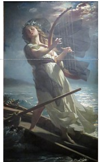
Jules-Eugène Lenepveu, Velléda, effet de lune (1883).