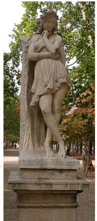
Hippolyte Maindron , Velléda contemplant la demeure d'Eudore (1844).