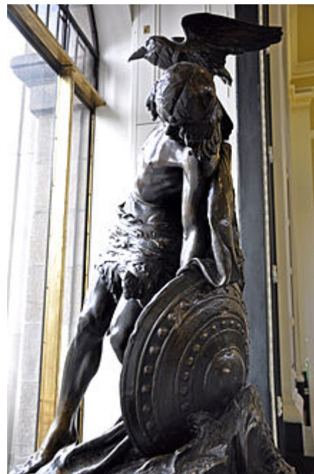
Statue représentant la mort de Cúchulainn à la poste centrale de Dublin. Cette statue commémore l'insurrection de Pâques 1916.