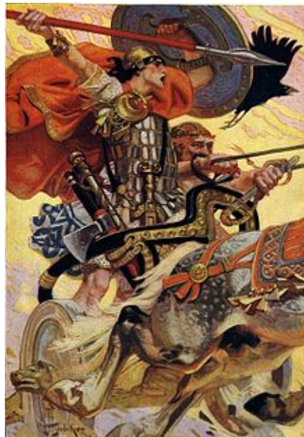
Cúchulainn au combat , illustration de Mythes et Légendes des Celtes , T. W. Rolleston, 1911 par Joseph Christian Leyendecker .